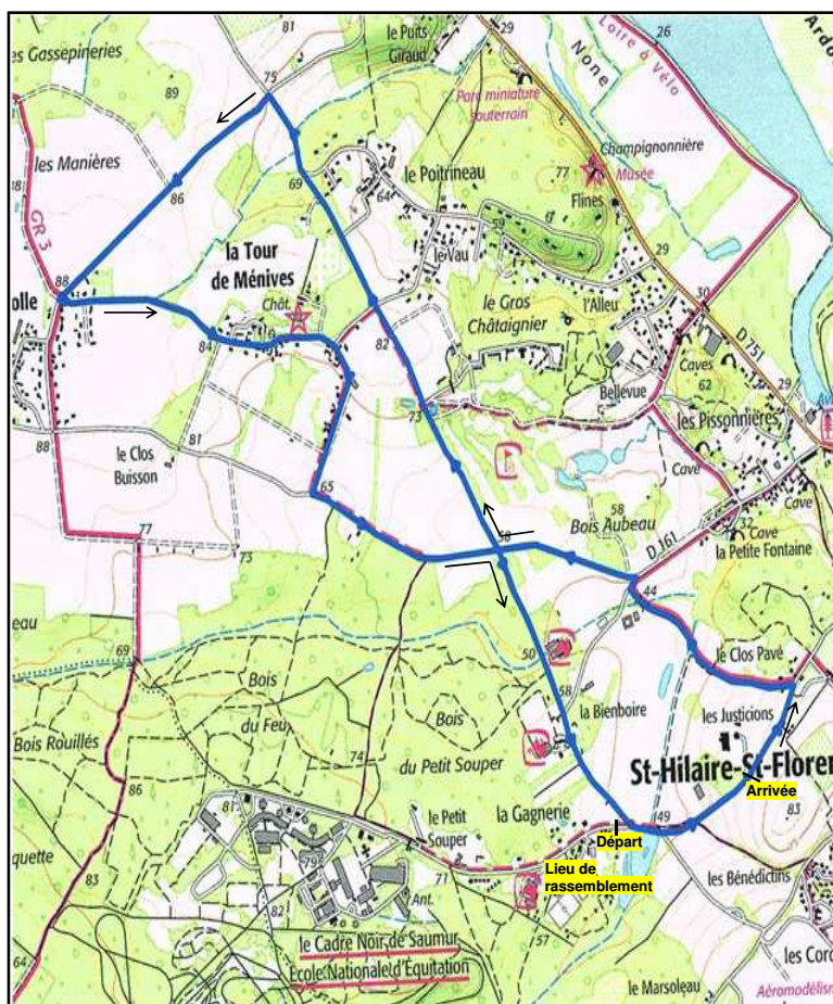
Circuit de 8,050 km

Pour plus d'informations vous pouvez contacter le 06 08 64 13 44 ou par mail: corbineau.jean-michel@wanadoo.fr